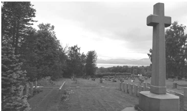
Foto – pohled od památníku padlých vojáků Commonwealthu, Francouzské armády a polské exilové armády upomínající na námořní bitvy a pozemní boje v okolí Narviku mezi 9.4. a 8.6. 1940 na Narvikfjord

Nová expozice je financována z investičního programu tzv. norských fondů. Partnerskou institucí je Válečné muzeum v Narviku, které se zaměřuje na německou invazi na jaře 1940 a na válku jako takovou coby filozofický a sociologický fenomén. Zástupci MVČ se vydali do Norska v červnu letošního roku, norští kolegové návštěvu včetně prohlídky Muzea války 1866 a areálu bojiště oplatili v září. Realizace expozice je tak pravděpodobná v r. 2021, do té doby nabídne Muzeum války 1866 výstavní projekty připravované ve spolupráci s Vojenským historickým ústavem Praha a katedrou archeologie Filozofické fakulty Univerzity Hradec Králové. Je rovněž plánována revitalizace nedaleké rozhledny. Kromě toho se návštěvníci mohou těšit na tradiční zahájení sezony, Muzejní noc a rekonstrukci bitvy. Mimo jiné dojde i k opakování přednáškového cyklu, určeného především příznivcům prusko-rakouské války z řad vojensko-historických klubů a dalším zájemcům. Pro školy Muzeum války 1866 nabízí nově zpracovaný muzejně-pedagogický program určený pro 2. stupeň základních škol a pro gymnázia. Během ledna a února 2020 však bude budova uzavřena z důvodu montáže nového ventilačního a klimatizačního systému.