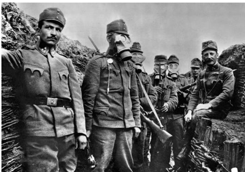
Naši předkové se na západní frontě stávali cílem plynových útoků, takže ochranné prostředky přišly vhod

Na západní frontě přišla habsburská monarchie o zhruba 10 000 padlých a raněných, nicméně můžeme říci, že obstála se ctí. Můžeme konstatovat, že naši předkové bojující za podunajskou říši bojovali na téměř všech bojištích Velké války, od Ruska až po Francii, proti Itálii, Rumunsku, na Balkáně či třeba v Palestině nebo na dálném východě. O účasti našich pradědečků na druhém konci světa si něco povíme třeba příště.